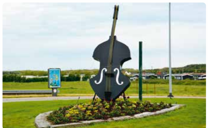
Een beeld uit de campagne van vorig jaar.