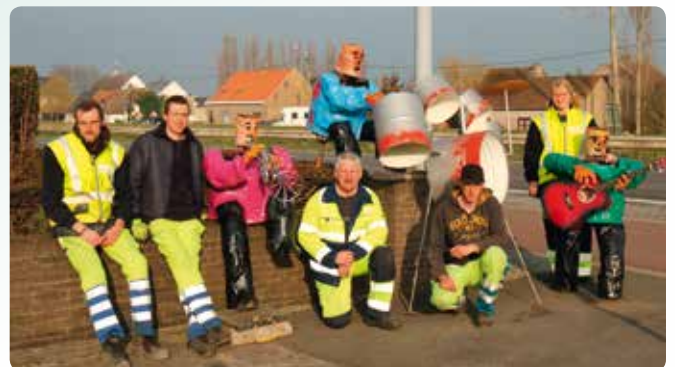
Onze groenmedewerkers zijn al volop bezig met de voorbereidingen voor dit seizoen.

Nieuwe kandidaten zijn steeds welkom en kunnen inschrijven via 059 31 31 31 of bebloemingswedstrijd@middelkerke.be .